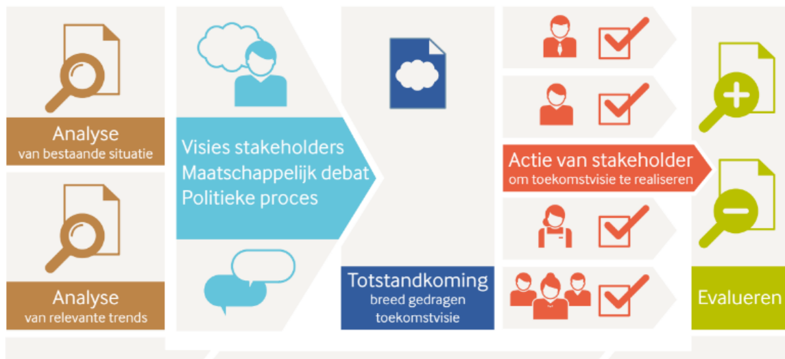
Figuur 1 Beleidscyclus detailhandelsbeleid 6

Kern van dit overzicht is dat partijen vanuit een breed gedragen en goed onderbouwde toekomstvisie hun beleid en acties vormgeven en die regelmatig evalueren en zo nodig bijstellen. Figuur 2, ook gebaseerd op het Platform31-rapport, geeft een overzicht van de verschillende partijen en hun verwevenheid.